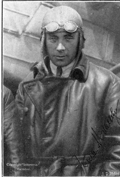
† Walter Mittelholzer

Das eidg. pol. Departement wurde beauftragt, die fremden Staaten zu dem vom 28. August bis 4. September in Zürich stattfindenden Internationalen Kongreß für Geschichtswissenschaften einzuladen.