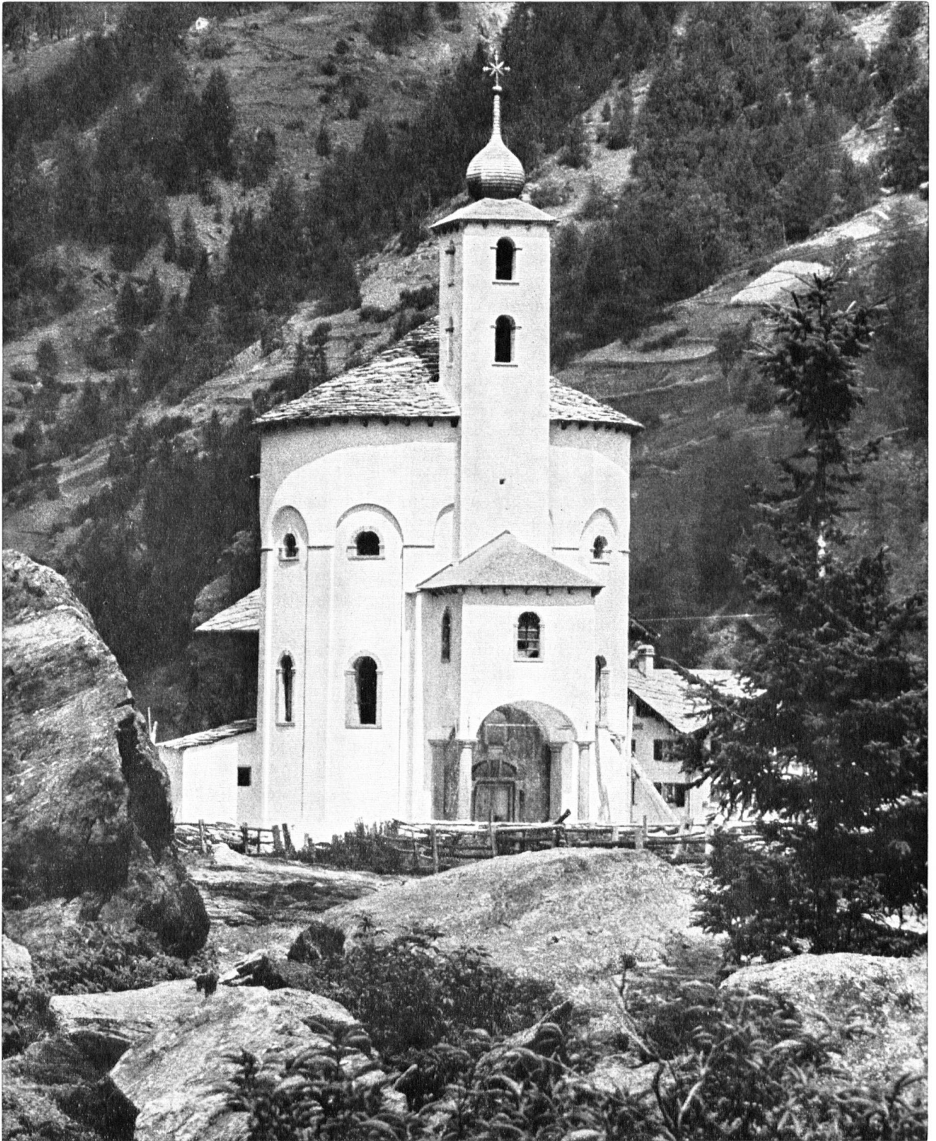
L'église de Saas Balen, une fois achevée la restauration, 1963/64.