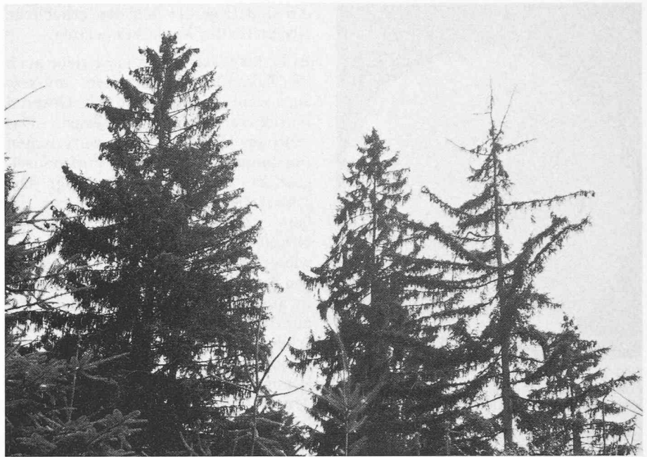
Alle diese Fichten sind geschädigt, die äusserste, hohe rechts ist praktisch tot: dürrer Gipfeltrieb, sehr weitgehender Nadelverlust

Bei den Anstrengungen zur Verminderung der Luftverschmutzung ist jeder, auch der kleinste Anteil, von Bedeutung. In den allernächsten Jahren wird es vor allem darum gehen, die Kurve der Verschmutzungen nicht weiter ansteigen zu lassen. Dabei ist das schon jetzt hörbare Argument, diese oder jene Massnahme bringe nicht viel Reduktion, unannehmbar. Bei jeder denkbaren Massnahme wird im schwerfälligen