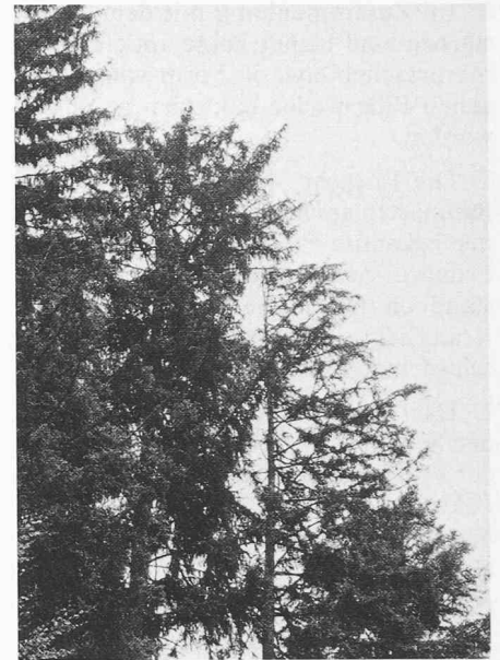
Rand eines Altbestandes, verschiedene Stadien der Entnadelung und damit des Absterbens von Fichten

Seit Jahrzehnten ist bekannt, dass Luftverschmutzungen schwere Schäden am Wald verursachen können. In allen Industrieländern der Welt, so auch in der Schweiz, sind in der Vergangenheit einzelne Waldschäden in räumlich meist eng begrenzten Gebieten aufgetreten. Bisher waren die beobachteten Waldschäden also stets und eindeutig in Zusammenhang zu bringen mit bestimmten Emittenten von pflanzengiftigen Schadstoffen. Seit Beginn der 80er Jahre treten jedoch weiträumig verteilte Waldschäden auf, die von bekannten Schadstoffquellen weit entfernt liegen. Das ist eine völlig neue Situation. In wissenschaftlichen Kreisen wird vermutet, dass diese neuen Schäden auf die weiträumig verteilte Luftverschmutzung zurückzuführen seien. Diese Vermutung stützt sich auf eine Anzahl wissenschaftlich einwandfrei bewiesener Tatsachen, einige davon sind im folgenden aufgezählt: