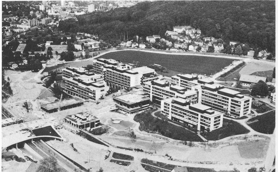
Luftaufnahme. Im Vordergrund rechts die 2. Etappe, Mensa; links der Neubau des Staatsarchivs

Bewilligung eines Bruttokredites von Fr. 29,4 Mio. für die Infrastrukturanlagen durch den Kantonsrat (Parkhaus, Verkehrsanschluss, Fussgängerbrücke)