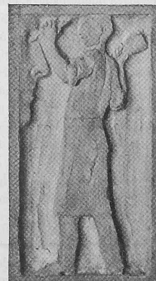
Abb. 22. Detail eines Emporenkapitäl.

wir auf einen seit dem 16. Januar 1905 durchgeführten Versuchsbetrieb auf der Teilstrecke Seebach-Affoltern zu verweisen. Dieser Versuchsbetrieb hat ergeben, dass hohe Spannungen vollständig betriebssicher verwendbar sind und dass es möglich ist, wie wir an der Frankfurter elektrischen Ausstellung nachgewiesen haben und wie es seither in der Kraftübertragungstechnik geschieht, die mit solch hohen Stromspannungen erreichbare Wirtschaftlichkeit auch bei den Fahrdrathleitungen von Bahnen auszunützen. Die Verlängerung Affoltern-Regensdorf befindet sich in Ausführung und wurde nur deshalb nicht früher in Angriff genommen, weil erst Gewissheit darüber erlangt werden musste, ob die der ganzen Strecke entlang gehenden interurbanen Telefonstränge nicht gestört, und ob die mit der Verlegung dieser Stränge verbundenen Kosten vermieden werden können, was nunmehr der Fall ist. Wir hoffen nun in kürzester Zeit zum Abschluss unserer Versuchsanlage zu kommen. Wir bedauern nur, dass mit der Einführung des elektrischen Betriebes im Simplontunnel nicht zugewartet werden konnte, bis die Resultate der Versuche,