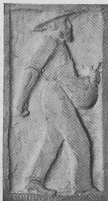
Abb. 21. Detail eines Emporenkapitäl.

8. Dieser Bundesbeschluss wird nach Massgabe von Art. 89, Abs. 2, der Bundesverfassung als dringlich erklärt und tritt sofort in Kraft.»