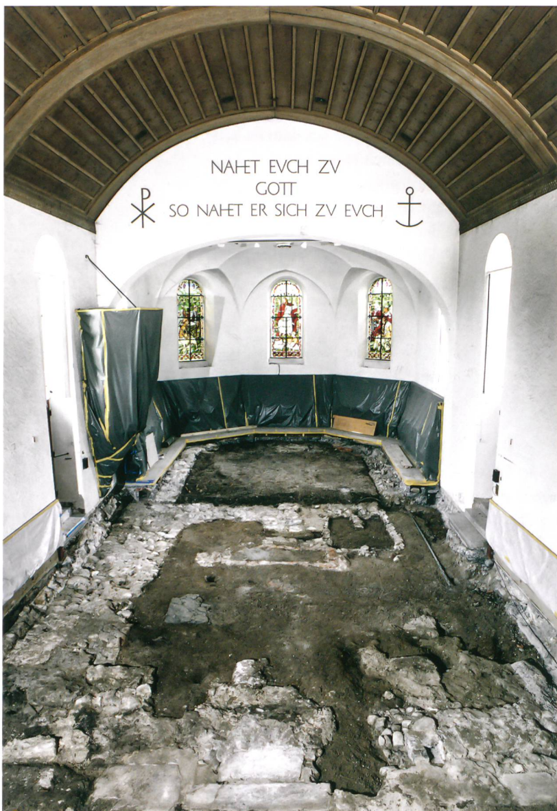
Abb. 1: Münsingen, Kirche. Die sichtbaren älteren Kirchgrundrisse nach der Entfernung des Bodens. Blick nach Osten.

vor Errichtung des heutigen Predigtsaales aus dem frühen 18. Jahrhundert bestanden haben.