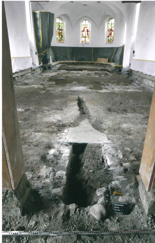
Abb. 6: Münsingen, Kirche. Der Kanal der Warmluftheizung von 1907. Blick nach Osten.

1907 wurde der Berner Münsterbaumeister Karl Indermühle beauftragt, den Innenraum der Kirche dem Zeitgeschmack entsprechend zu erneuern und 1915 dem Schiff im Westen eine Vorhalle anzufügen (Abb. 2, Phase VII, violett). Im Mittelgang des Kirchenschiffs wurde ein mit