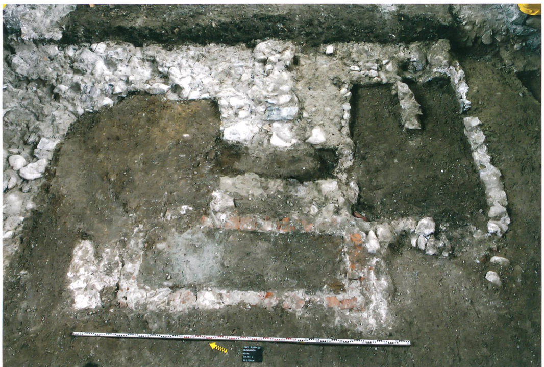
Abb. 5: Münsingen, Kirche. Grabgruben schneiden den Rechteckchor der frühromanischen Kirche. Blick nach Osten.

eine kreuzförmige Kirche. Auf Höhe der westlichen Choransätze ist ein Triumphbogen zu rekonstruieren, der das Sanktuarium, das den Geistlichen vorbehalten war, vom Langhaus, dem Aufenthaltsort der Gemeinde, trennte. Die Münsinger Kirche unterscheidet sich mit ihrer Saalform von den meisten romanischen