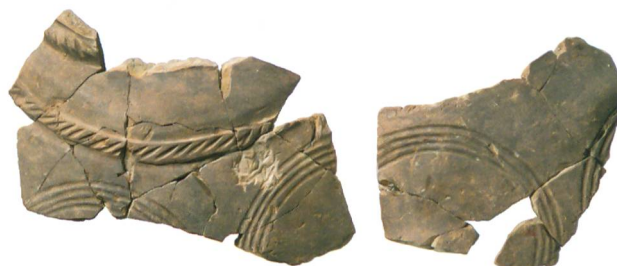
Abb. 4: Köniz, Chlywabere. Fragmente eines verzierten feinkeramischen Topfs der frühen Spätbronzezeit. M. 1:2.

In einer zweiten Phase wurde für den Bau des Gebäudes das Gelände leicht aufplaniert. Anschliessend wurden die beiden im Verband stehenden Mauern 207 und 227 erstellt. In einer nächsten Etappe folgte der Anbau der Mauern 204 und 205/206, sodass ein rechteckiger Raum von 9 \times 7,3 m mit einer Innenfläche von 54 \text{ m}^2