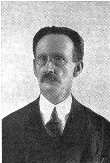
Prof. Dr. Adolpho Luz

Wir beschränken uns darauf, einen der weniger schlimmen Fälle anzudeuten, der sich während einer schweren Epidemie in den Gegenden von S. Paulo und Santos ereignete. Dr. Luz war eines Morgens gerade im Begriff aus der Tür zu schreiten, um zur Bahn nach Santos zu eilen, und die dortigen Kranken zu besuchen, die er nach seiner Methode behandelte. In diesem Augenblick erschien Dr. Emilio Ribas, (Direktor des öffentl. Sanitätswesens), und erklärte: „Dr. Luz, Sie dürfen nicht fahren; ein Vertrauensmann hat uns mitgeteilt, daß in Santos eine Mörderbande bereit steht, um Sie umzubringen.“ — „Oh was!“ erwidert Dr. Luz; „ich kann doch deswegen meine Kranken nicht im Stich lassen!“ — „Bleiben Sie hier bis morgen!“ bittet Dr. Ribas; „ich lasse Sie nicht hinaus“; und damit stellt er sich mit ausgebreiteten Armen vor die Tür. Aber Dr. Luz schiebt ihn mit Gewalt zur Seite und rennt hinaus. — An der Bahn tritt ihm der Bahnhofsvorstand, ein Engländer, entgegen: „Dr. Luz, Sie können nicht reisen; wir haben Nachricht von einem Komplott gegen Sie.“ — „Das wäre noch besser! Ich muß nach meinen Kranken sehen, und davon wird mich kein Komplott abhalten.“ — „Sie können nicht reisen; der Zug nimmt Sie nicht mit!“ — „Das wollen wir sehen!“ erwidert Dr. Luz, und springt in den nächsten Wagen. Kaum ist er drin-