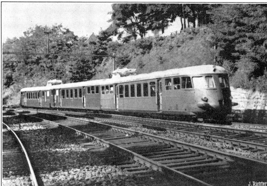
Die neuen Leichttriebwagenzüge der S.B.B.

Auf der Rückkehr von der Besteigung der Liguille d'argentiere stürzte Bundesrichter Louis Couchepin 15 Meter tief in eine Gletscherspalte. Es gelang, den Verunglückten rasch zu befreien und in die Cabane du Trient zu bringen. Er erlitt feinerlei Verletzungen, doch einen gewaltigen Nervenschod.