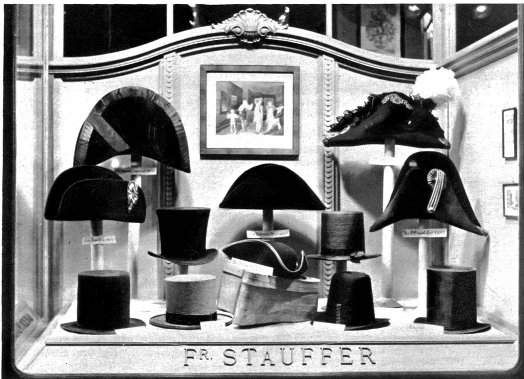
Hüte, wie man sie in Bern vor 150 Jahren trug