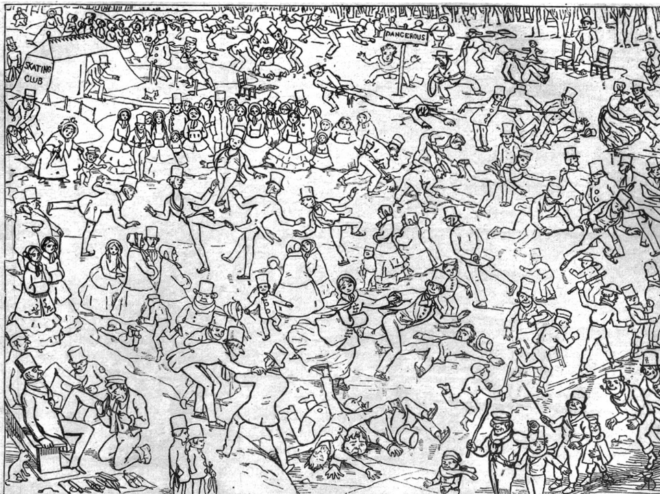
Winterfreuden in England um 1850. Aus der Zeitschrift „Punch“.