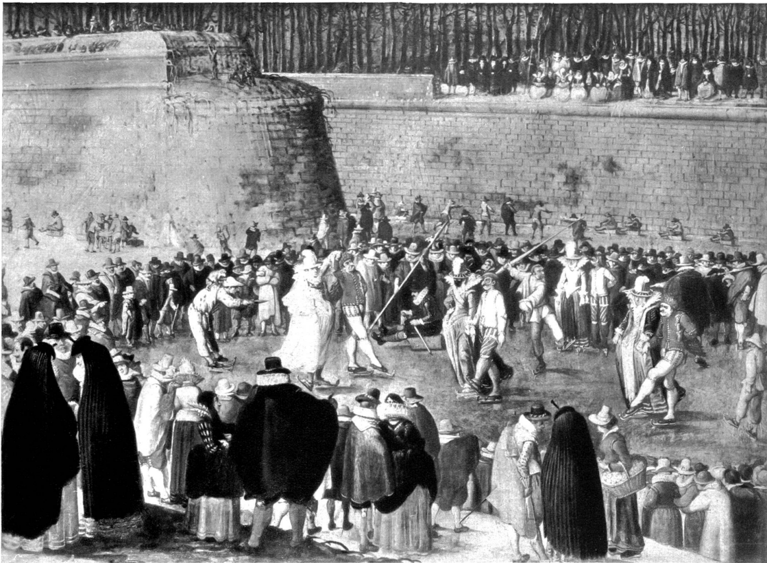
Van Hienbaut. Karneval auf dem Eise