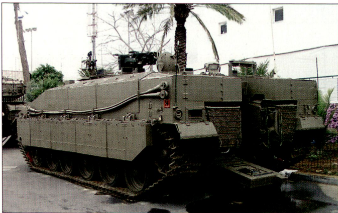
Neuer israelischer Truppentransporter auf der Basis des Kampfpanzers «Merkava Mk1».

Im Hinblick auf eine permanente Lösung für den ausgewiesenen Bedarf an gepanzerten Transportmitteln für Einsätze v.a. im urbanen Gebiet hat das israelische Verteidigungsministerium die Entwicklung einer speziellen Truppentransportversion auf der Basis des Kampfpanzers «Merkava Mk1» in Auftrag gegeben. Der neue Transportpanzer mit der Bezeichnung «Tiger» hat eine gewisse Ähnlichkeit mit dem ebenfalls auf dem Panzer «Merkava» basierenden Bergepanzer (siehe auch «ASMZ» 10/2002, Seite 46). Ein Prototyp des «Tiger» wurde erstmals anlässlich der Konferenz LIC (Low Intensity Conflicts) im März 2005 in Tel Aviv gezeigt. Der neue Transportpanzer soll mit einer fernbedienbaren Automatenkanone, vermutlich vom Kaliber 30 mm, sowie mit einem leichten Minenwerfer 60 mm ausgerüstet werden. D.E.