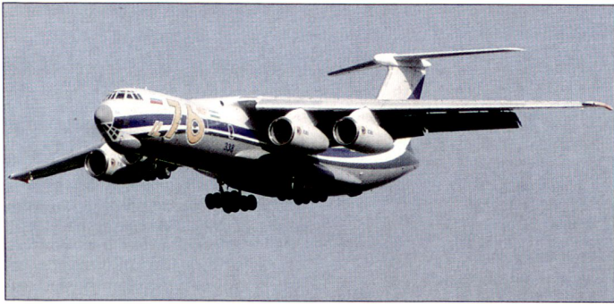
Russische Transportflugzeuge vom Typ Il-76 «Candid» stehen weltweit in zivilen und militärischen Versionen im Einsatz.