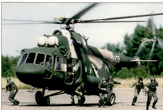
Die neue Generation von Mi-17-Helikoptern wird von Russland in diversen Typenvarianten angeboten.

Hergestellt werden die Helikopter der Mil-Serie in Ulan Ude in der Nähe des Baikalsees. Die Endmontage der für Tschechien vorgesehenen Maschinen soll im tschechischen Pardubice vorgenommen werden. Bereits haben 14 tschechische Piloten mit einem Ausbildungskurs bei den Mil-Herstellerwerken in Ulan Ude begonnen. hg