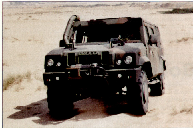
Mehrzweckfahrzeug «Caracal» mit verbessertem Schutz.

schzeitlich diverse so genannte geschützte Fahrzeuge unterschiedlicher Typen (z.B. «Dingo 2», «Duro 3», «Mungo» usw.) aus Mitteln des Sofortbedarfs beschafft worden. Gleichwohl verfügt die Bundeswehr gemäss Aussagen des Einsatzführungsstabes über ein qualitatives und quantitatives Defizit an leistungsfähigen, geländegängigen Fahrzeugen unter-