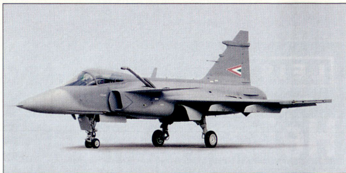
Die Einführung des «Gripen» in die ungarische Luftwaffe läuft nach Plan.

tschechische Piloten bei der schwedischen Luftwaffe ausgebildet worden. Unterdessen ist bei den tschechischen Luftstreitkräften die eigene Ausbildung mit den ausgelieferten Doppelsitzern angelaufen. Die 12 Einsitzer sowie 2 Doppelsitzer sind von Tschechien vorerst für 10 Jahre gemietet wor-