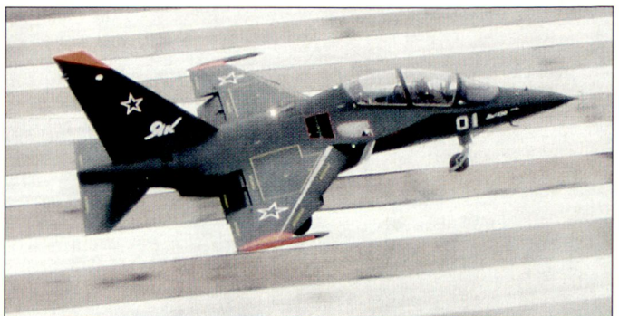
Die russische Luftwaffe hat sich für das Trainingsflugzeug Yak-130 entschieden.

stimmt. Dies obwohl gewisse Kreise in der russischen Militärführung weiterhin auch das Konkurrenzprodukt MiG-AT ins Auge gefasst haben. Unterdessen stehen einige wenige Prototypen des Typs Yak-130 für Testzwecke zur Verfügung. Eine offizielle Bestellung ist bisher ausgeblieben. Nun soll für 2006 die erste Tranche des dringend benötigten Trainingsflugzeuges budgetiert und beschafft werden. Die Yak-130 soll sowohl für die Grundschulung als auch das fortgeschrittene Training der russischen Piloten genutzt werden. hg