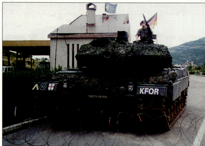
Die Schwerpunkte bei den laufenden Auslandseinsätzen der Bundeswehr liegen bei der KFOR in Kosovo und der ISAF in Afghanistan.

Um die Wehrpflicht auf Dauer in Deutschland erhalten zu können, muss aber die laufende Diskussion mit glaubhaften Argumenten und Fakten geführt werden. Der deutsche Reservistenverband, der heute noch mehr als 137 000 Mitglieder vertritt, sieht hier vor allem Handlungsbedarf. Der Verband will sich zudem vermehrt dafür einsetzen, dass geeignete Reservisten für die Einsatzkontingente rekrutiert werden können. hg