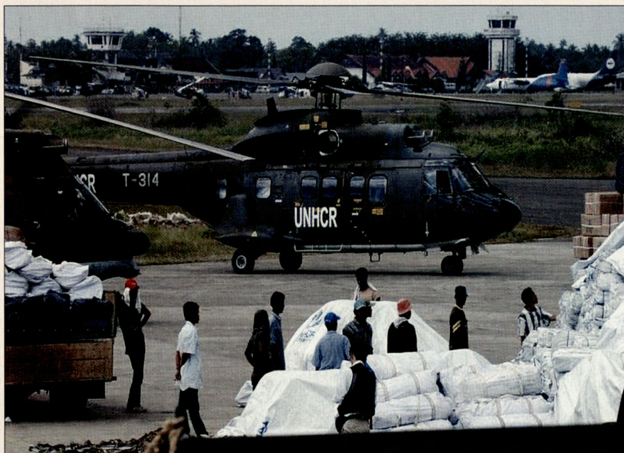
Die Helikopter fliegen im Auftrag des UNHCR.

Mitte Februar erklärte die indonesische Regierung die Phase der Soforthilfe als beendet. Die Vereinbarung mit dem UNHCR legte den 27. Februar als letzten Einsatztag fest. Insgesamt produzierten wir an 42 Flugtagen 477 Flugstunden praktisch ohne technische oder operationelle Probleme und transportierten 370 t Material und 2300 Personen. Nun erfolgte der Rücktransport des Materials (3 Super Puma, 4 Container, 1 Shelter, gesamthaft 45 t Material) wiederum mit 2 AN-124. Am 12. März traf das Gros der Task Force wie-