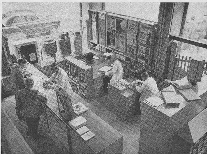
und in seinem Sekretariat über alles rasch Auskunft geben zu können.