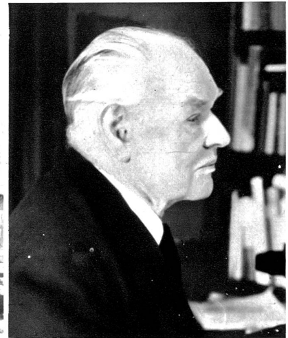
In Lugano-Ruvigliana, wo er seinen Lebensabend verbringt, beging am 29. November 1937 Friedrich Klose seinen 75. Geburtstag. Klose ist Bürger von Genf, war Professor der Kompositionslehre an der Akademie f. Tonkunst in München, ist Ehrendoktor der Universität Bern. Der Jubilar ist Verfasser des Buches „Meine Lehrjahre bei Bruckner“. — Von seinen wichtigsten Kompositionen sind zu nennen: Das Leben, ein Traum. Es-Dur-Streichquartett, Die Wallfahrt nach Kevlaar, Der Sonne Geist usw. usw.