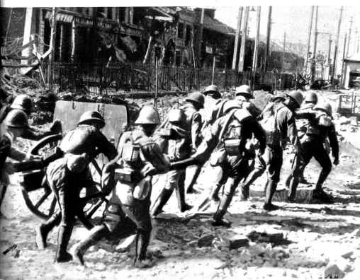
Einnahme Tschepais durch die Japaner. Sie erfolgte nach schwerem Luft- und Artilleriebombardement.