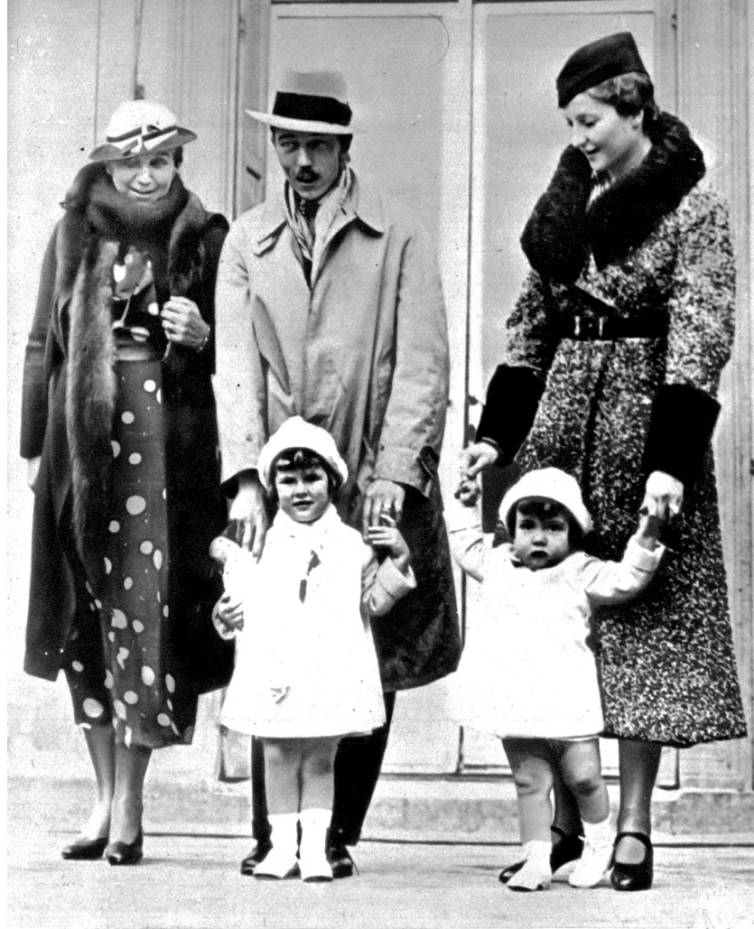
Graf von Paris wegen monarchistischer Versammlung aus der Schweiz ausgewiesen. Am 23. November 1937 wurde der Graf von Paris, Sohn des Herzogs von Guise, der als rechtmässiger Nachfolger der französischen Könige gilt, aus der Schweiz ausgewiesen. Der Graf hatte sich nach der Schweiz in die Villa eines Freundes begeben, der hier eine monarchistische Versammlung veranstaltet haben soll. Unser Bild zeigt den Graf und die Gräfin von Paris mit ihren Kindern vor dem Schloss d'Anjou, ihrem regelmässigen Wohnsitz in Belgien. Links ist die Mutter des Grafen von Paris, die Herzogin von Guise.