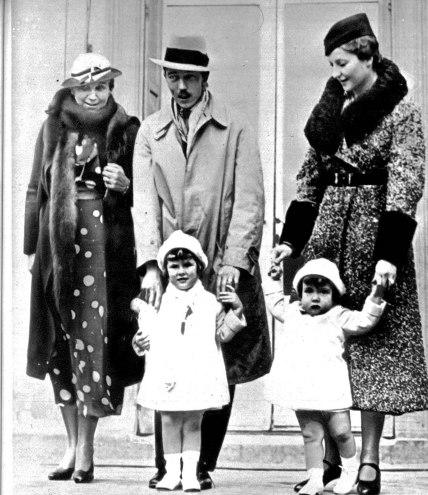
Graf von Paris wegen monarchistischer Versammlung aus der Schweiz ausgewiesen. Am 23. November 1937 wurde der Graf von Paris, Sohn des Herzogs von Guise, der als rechtmäßiger Nachfolger der französischen Könige gilt, aus der Schweiz ausgewiesen. Der Graf hatte sich nach der Schweiz in die Villa eines Freundes begeben, der hier eine monarchistische Versammlung veranstaltet haben soll. Unser Bild zeigt den Graf und die Gräfin von Paris mit ihren Kindern vor dem Schloss d'Anjou, ihrem regelmäßigen Wohnsitz in Belgien. Links ist die Mutter des Grafen von Paris, die Herzogin von Guise.