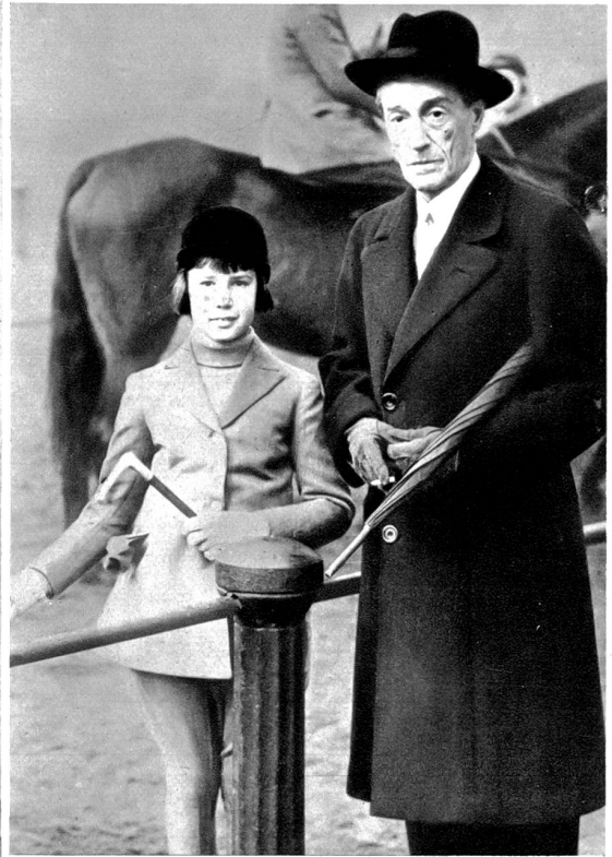
Der Herzog von Alba, Nationalspaniens Vertreter in London. Im Anschluss an einen Notenaustausch zwischen dem Foreign Office in London und Salamanca ist der Herzog von Alba, einer Reuter-Meldung zufolge, zum amtlichen Vertreter des nationalen Spaniens in London ernannt worden. Der Herzog von Alba, der spanischer Grande und Angehöriger des britischen Adels ist, wurde hier von unserm Bildberichterstatter mit seinem Töchterchen im Hyde-Park in London aufgenommen.