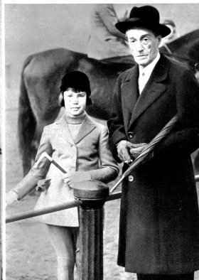
Der Herzog von Alba, Nationalspaniens Vertreter in London. Im Anschluss an einen Notenaustausch zwischen dem Foreign Office in London und Salamanca ist der Herzog von Alba, einer Reuter-Meldung zufolge, zum amtlichen Vertreter des nationalen Spaniens in London ernannt worden. Der Herzog von Alba, der spanischer Grande und Angehöriger des britischen Adels ist, wurde hier von unserem Bildberichterstatler mit seinem Töchterchen im Hyde-Park in London aufgenommen.