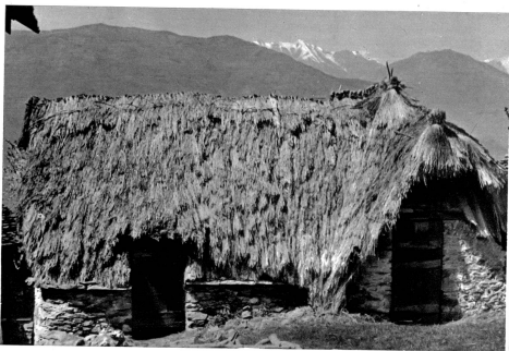
Wo ist da die neue Zeit? Alles wie einst, diese Aufnahme könnte auch vor vielen hundert Jahren gemacht worden sein.