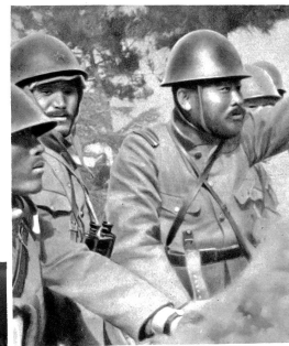
In einem japanischen Schützengraben

So wie jeder Kaiser und Minister Krieg und Frieden, Abreise und Anfall in der Heimat den Göttern mitteilen muß, ist es Pflicht jedes japanischen Soldaten vor Beginn eines Feldzuges, bei Abkommandierung und der Rückkehr vom Feldzug den Göttern Rechenschaft zu geben. Die japanischen Götter sind ja letzten Endes nur die Ahnen der jeweils lebenden Generationen, die ein Recht haben zu wissen, wie ihre Nachfahren das ewige Erbe der Familien und damit des ganzen japanischen Reiches verwalten.