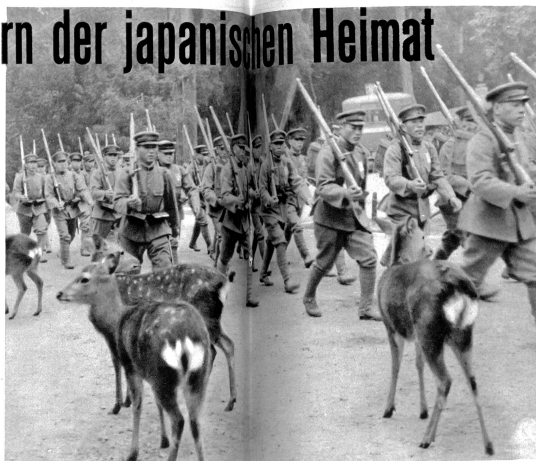
Abschiedsmarsch zu den Göttern. Eine Abteilung japanischer Soldaten, die nach der Mandschurei abkommandiert sind, marschieren durch den uralten Tempelhain des Kasuga Heiligtums in Nara, das durch seine zahlreichen zahmen Rehe weltbekannt ist.