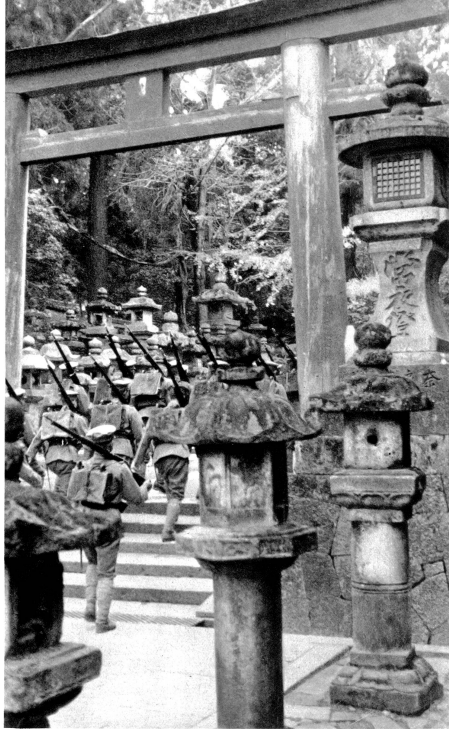
Japanische Soldaten marschieren durch den alten Tempelhain des Kasuga-Heiligtums in Nara