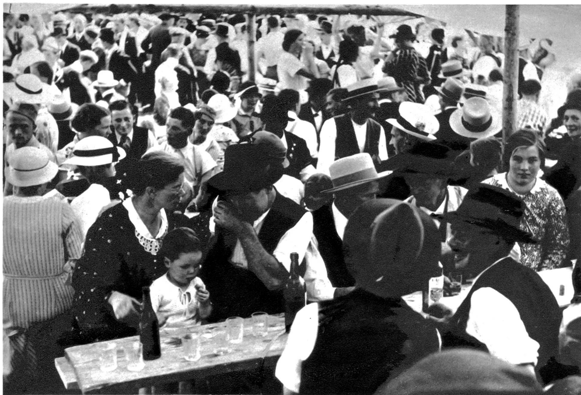
Das Bergfest ist in vollem Gange. Nach schwerem Tagewerk gönnt man sich auch einmal ein Tropfen vom „Bessern“