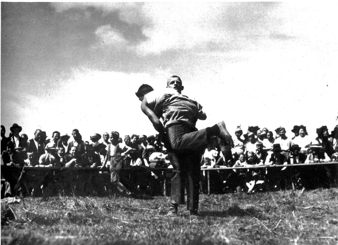
Kraftstrotzend ha- ben sie einander gepackt. Nicht nur bei der Tagesar- beit, sondern auch hier gilt es sich zu rühren