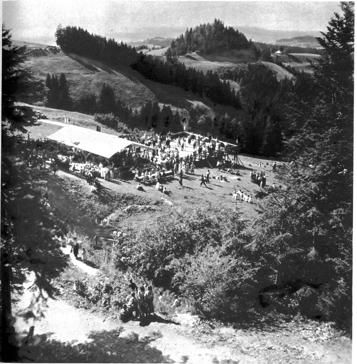
Die schöngelagene Lüderalp eignet sich bestens für die Chilbi