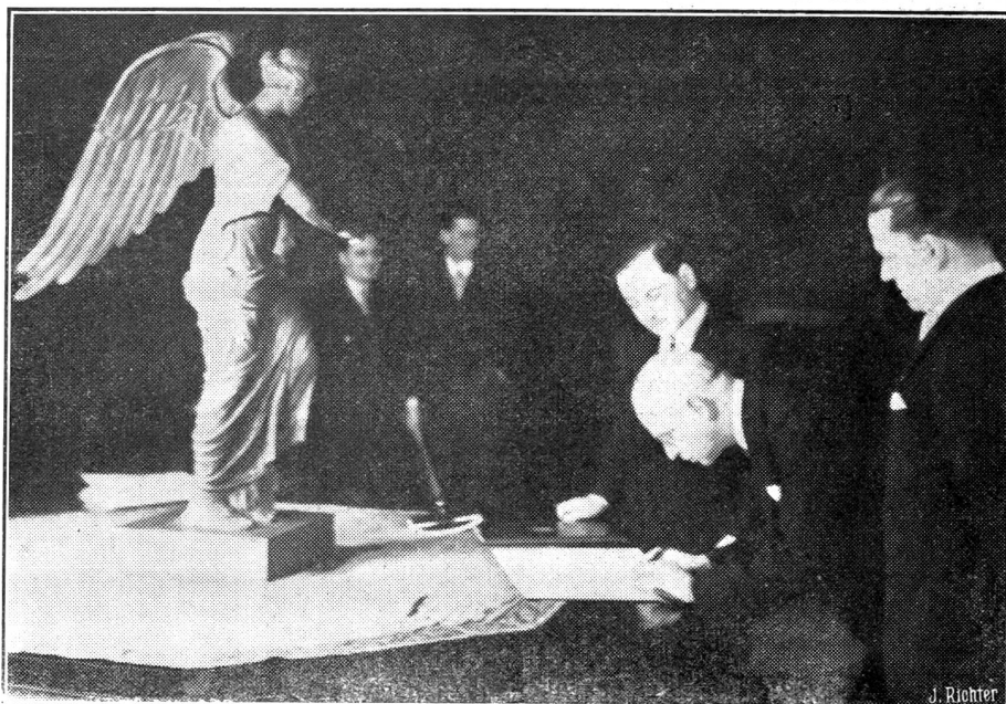
Die Unterzeichnung des englisch-italienischen Mittelmeer-Abkommens in Rom. Das Abkommen wurde in Rom, im Chigi-Palast, vom italienischen Außenminister Graf Ciano und dem englischen Botschafter Sir Eric Drummond unterzeichnet — Sir Eric Drummond bei der Unterzeichnung des Paktes. Rechts Graf Ciano.

Daneben aber bestehen einige äußerst dringliche Aufgaben: Die Errichtung der Grenzsperrn und die Besetzung mit ständig