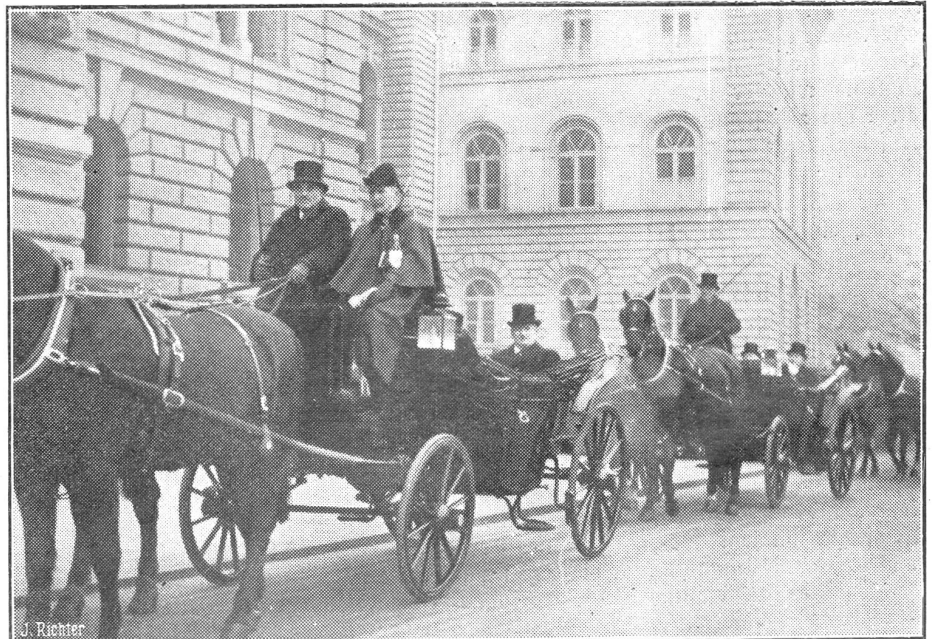
Neujahrsempfang im Berner Bundeshaus.

Sind wir gerüstet? Wirtschaftlich und militärisch? Oder sind die hochgerüsteten Nachbarstaaten uns in einem Tempo vorausgeilte, daß wir sie überhaupt nicht mehr einzuholen vermögen? Vor allem militärisch und „wehrtechnisch“? Das sind Fragen, die heute auch den überzeugtesten Pazifisten bei uns zu interessieren beginnen. Der Satz, daß nur die bessere Bereitschaft der Friedliebenden einen angriffsbereiten Gegner zurückhalte, wird in den großen Demonstrationen Westeuropas dem Publikum eingehämmert, damit es begreife, warum man rüste. Für unsere Verhältnisse wandelt sich der Satz: Nur eine völlig abwehrbereite Schweiz kann sicher sein, daß man ihre Neutralität respektiert. Es ist im Westen auch allgemeine Ansicht, der gefürchtete deutsche Gegner könnte entwaffnet werden, wenn man ihm wirtschaftlich aufhelfe... zugleich ist man in England und Frankreich überzeugt, nur ein wirtschaftlich befriedetes Land werde in der Abwehr eines Ueberfalles einig sein. In ganz gleicher Weise sind wir vom innern Wirtschaftsfrieden abhängig