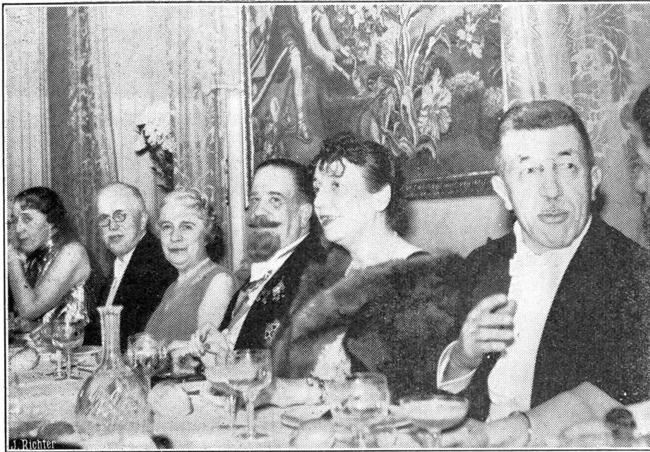
Der grosse Diplomatenball in Bern.