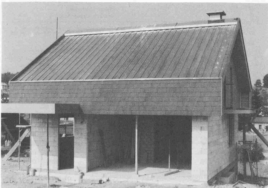
Bild 1. Energiedach Sessa-Therm

Das Energiedach Sessa-Therm ist ein Metaldach, mit dem der Umwelt – aus Sonne, Regen und Nebel – Wärme entzogen wird. Die Wärme wird mittels einer Wärmepumpe auf ein höheres Temperaturniveau gebracht, so dass sie für die Raumheizung und die Erwärmung des Brauchwassers verwendet werden kann. Das Energiedach Sessa-Therm ist aber nicht nur ein Wärmetauscher zur Aufnahme der Umweltwärme, sondern auch ein wasserdichtes, isoliertes Dach. Es ersetzt somit die herkömmliche Dacheindeckung inkl. Isolation.