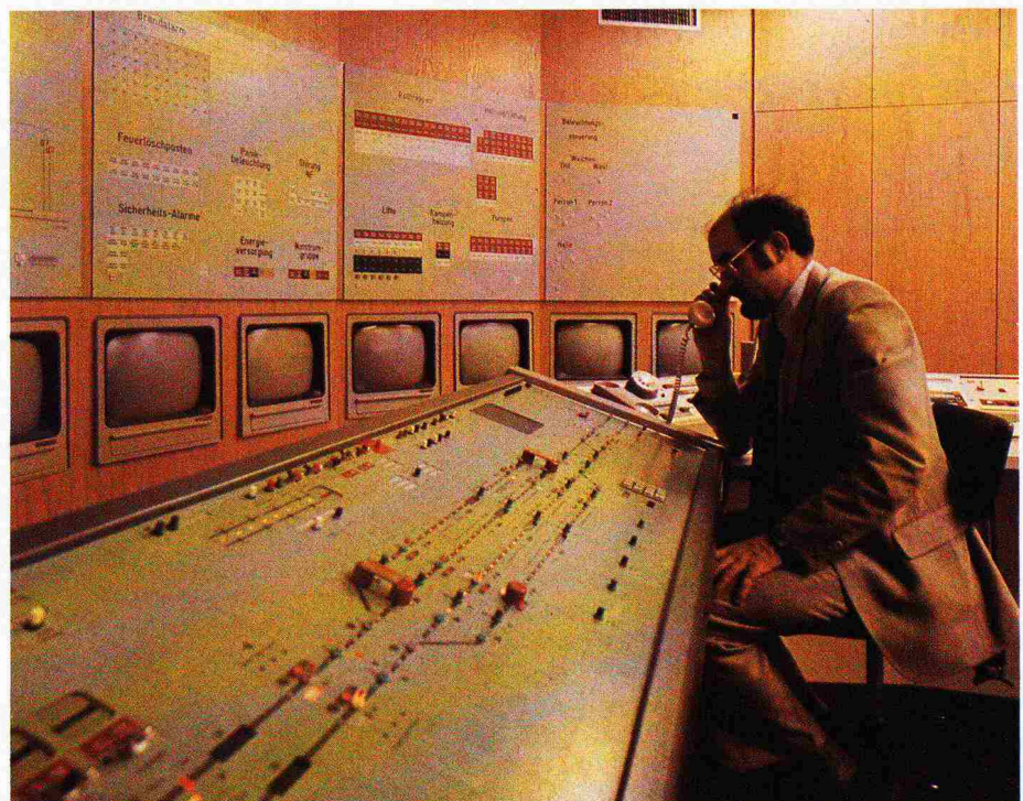
Bild 8. Leitstelle

Die administrativen und technischen Räume der SBB sind im Osten des