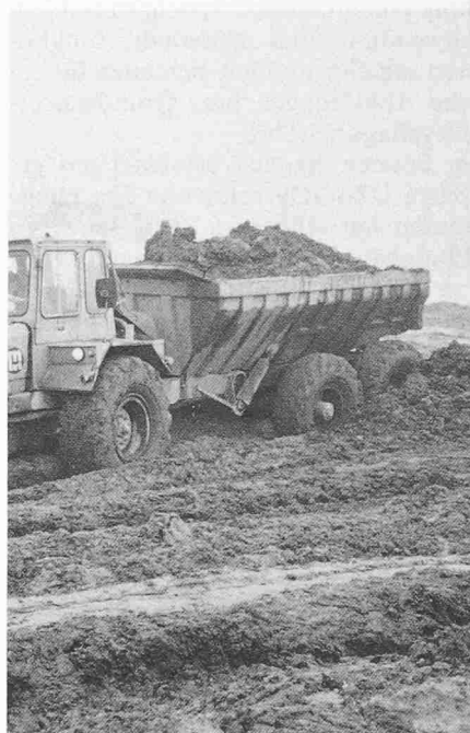
Bild 1. Auffüllarbeiten bei nassem Wetter

Durch die Untersuchungen sollen die Möglichkeiten und Grenzen der Tieflockerung bei der Sanierung von verdichteten Böden abgeklärt werden. Unter der Tieflockerung versteht man das Auflockern einer mindestens 40 bis 60