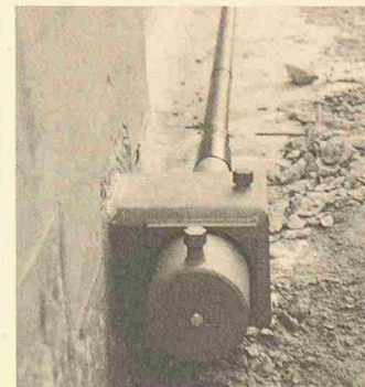
Bild 4. Die Verankerungen der externen BBRV-Spannkabel liegen auf quer zum Träger eingebauten RHS-Profilen