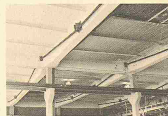
Bild 3. Seitlich neben den Trägern eingebaute Spannkabel in der Fabrikationshalle der Maschinenfabrik Schulthess