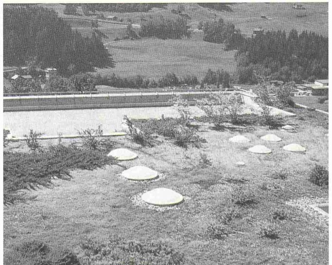
Bild 2. Heute ist auf Flachdächern fast alles möglich: Vom Kräutergarten bis zur «Parklandschaft» kann die Palette reichen