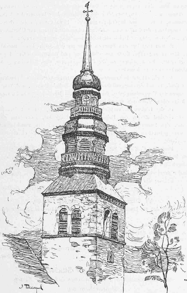
Clocher de Combloux.

Aus „Clochers Savoyards“ von John Torcapel.