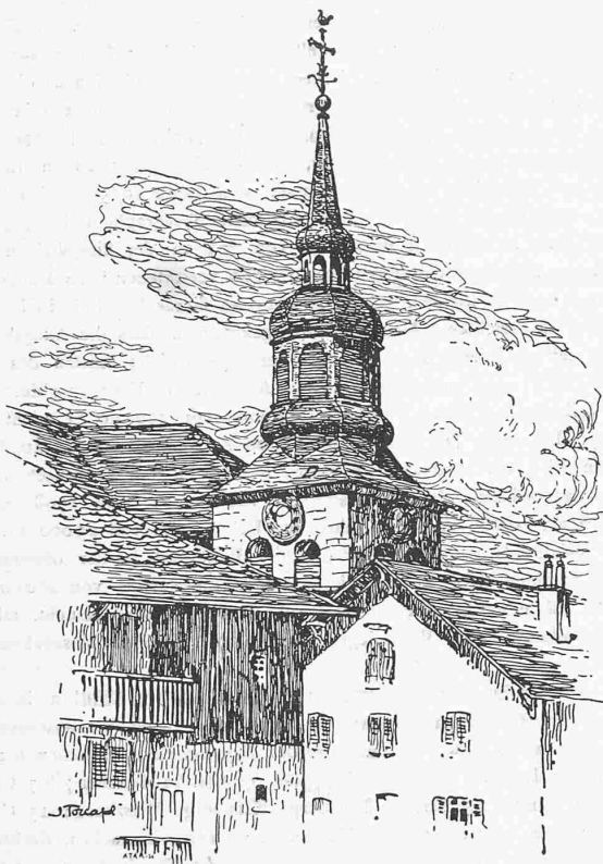
Clocher de Cruseilles.

Aus „Clochers Savoyards“ von John Torcapel.