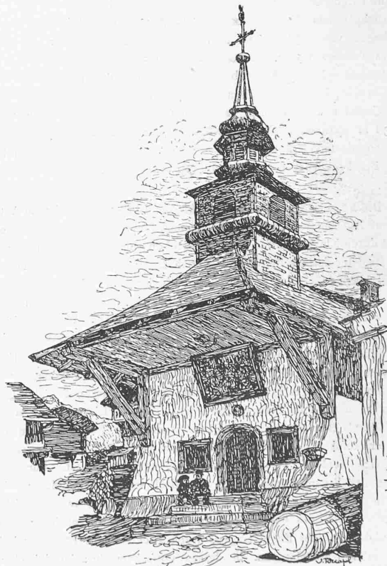
Chapelle à Salvagny. Vallée de Sixt.