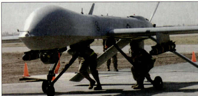
Unbemannter Aufklärungsflugkörper MQ-1 «Predator», ausgerüstet mit zwei Lenk Waffen «Hellfire».

Die aktuellen Planungen sehen nun für die nächsten zehn Jahre eine Erhöhung der Staffelanzahl auf 15 vor; jede Einheit (Staffel) soll über 12 Fluggeräte verfügen. Dabei sollen nebst der Grundversion MQ-1 später auch die leistungstärkere Weiterentwicklung MQ-9, ausgerüstet mit Turbopropo-Antrieb, beschafft werden. UAV-Systeme vom Typ «Predator» stehen bei den US-Streitkräften seit 1995 im Truppeneinsatz. Unterdessen bemühen sich auch andere Staaten (z.B. Italien) um eine Beschaffung solcher unbemannter Luftaufklärungssysteme. Ursprünglich waren die Flugkörper unbewaffnet und wurden mit RQ-1 bezeichnet. hg