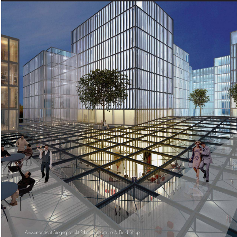
Aussenansicht Siegerprojekt Riken, Yamamoto & Field Shop