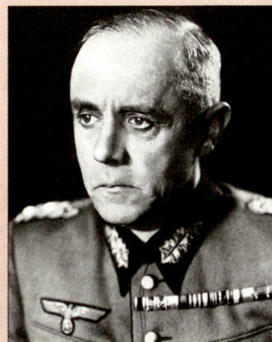
Generaloberst Ludwig Beck (1880–1944), Generalstabschef des deutschen Heeres 1935–1938. Bekannt durch seine Beteiligung am Widerstand gegen Hitler. Er verkörperte bedingungslos militärische Tugenden. Insbesondere prägte er Generationen von Generalstabsoffizieren in der Klarheit des Denkens, der Sprache und des aufopfernden Arbeitens. Von ihm stammt der Ausspruch: Wer klare Begriffe hat, kann führen. AM Bild: Buchheit Gert, Ludwig Beck, ein preussischer General, München 1964, Vorsatzblatt.