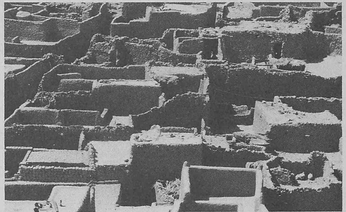
Ighzer, Dachlandschaft einer kompakten Siedlungsanlage

tektek Hans Imesch und Hans-Ulrich Thomann durchgeführten planerischen Analyse «Timinoun, Habitat-Rural unter den Bedingungen eines trocken-heissen Wüstengebietes». Es ging darum, typische Siedlungsformen im bestehenden Zustand zu