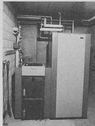
Hoval-Holzessel VarioLyt H16 mit Speicher-Wassererwärmer CombiVal R 300

Von Anfang an wurde bei einer Heizungsanlage in Bottmingen/BL die sichere und energiepolitisch sinnvolle Installation mit einer kombinierten Holz- und Elektrozentralpeicher-Heizung bevorzugt. Bei diesem Objekt belaufen sich die Jahresko-