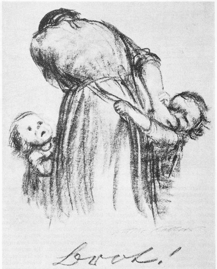
Käthe Kollwitz: «Brot»

In der Generation nach den zwei Weltkriegen nehmen viele die Stadt an, freilich ohne Begeisterung. Sie entdecken nicht wie noch Max Brod «die Schönheit des Pflasters» in ihren Steinen. Sie lassen sich auch nicht täuschen wie einer der expressionistischen Arbeiterdichter, die der Sang der Stadt traf «wie greller Tubaschrei, nicht Hirtenflöte taugt ihm, nicht Schalmei». Unsere