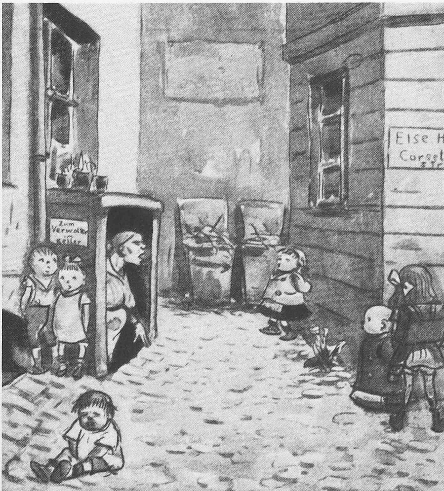
Heinrich Zille: «Wollt ihr weg von die Blume, spielt mit'n Müllkasten!»

Da wachsen Kinder auf an Fensterstufen, die immer in demselben Schatten sind, und wissen nicht, dass draussen Blumen rufen zu einem Tag voll Weite, Glück und Wind - und müssen Kind sein und sind traurig Kind.