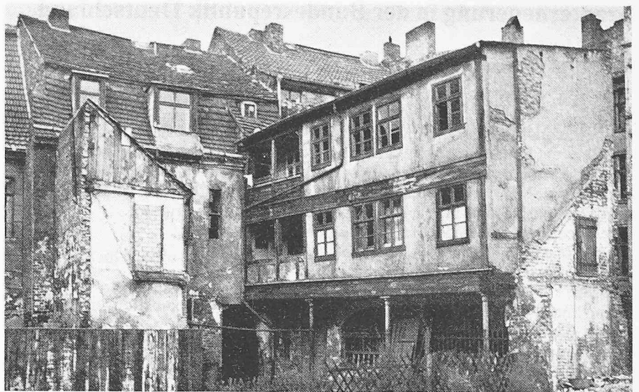
Hof an der Fischerstrasse, vor dem Abbruch

Es ist eine ungeheure Anstrengung nötig, um die Verkehrsplattformen, die so gefrässig nach der einstigen strahlenden Mitte der Städte greifen, so einzufrieden, dass das eigentliche Leben inmitten der Stadt gelebt werden kann, ja, dass die Stadt das lebendigste Leben geradezu anzieht. Es braucht eine energische Bemühung, um die rationale Intelligenz mit ihren Hirnpalästen im Leib der Städte so unterzubringen, dass der Computer nicht an die Stelle der Häu-