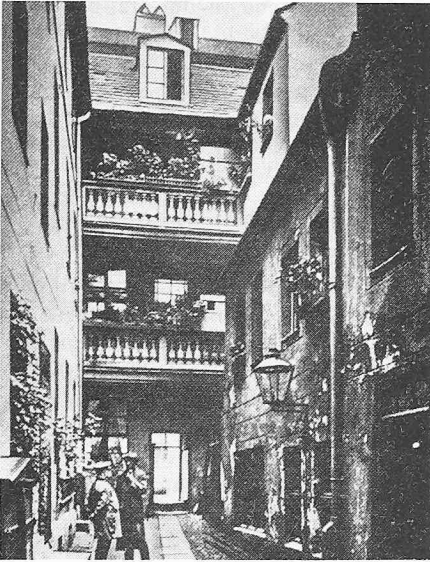
Berlin: Hof an der Fischerstrasse, um 1900

kontinentalen und globalen Verantwortung waren? Eine Stadt von heute ist vor allem in der Schweiz so stark mit der Landschaft und damit auch mit der nächsthöheren politischen Grösse, dem Kanton, und durch diesen mit der Nation verwachsen, dass die Stadt als kulturelle und menschliche Wirklichkeit ebenso wie als Ganzheit von Wohnbereich und Arbeitsplatz etwas geographisch Weiträumiges geworden ist.