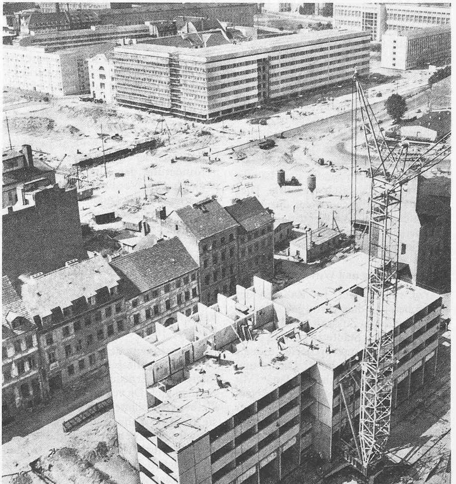
Berlin: Abbruch der alten Häuser an der Fischerstrasse, im Vordergrund Montage von Hochhäusern. Von der Trostlosigkeit in die Öde...

Die Städte leben von der Einsicht und der menschlichen Kraft, die das innerlich Erkannte dem äusserlich Gestaltbaren gegenüber zur Gestaltung bringt.