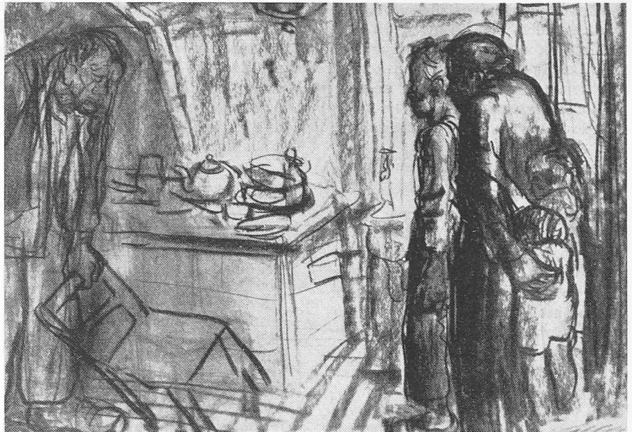
Käthe Kollwitz: «Trinker bedroht Familie»

Heinrich Zille (1885–1929). In volkstümlich humoristischen und zugleich satirisch anklagenden Zeichnungen schilderte er das «Milljöh» des Berliner Proletariats. «Vater Zille» genoss grosse Popularität über die Elendsquartiere hinaus, wo er sein einfaches, arbeitsames Leben grösstenteils in einer zweifelhafte Stube beim Bahnhof Westend verbrachte. Als Autodidakt gewann der Zeichner und Maler Zille (später Mitglied der Akademie) bedeutendes Ansehen. Hierzu trug auch seine Mitarbeit für die «Jugend», den «Simplicissimus» und andere illustrierte Blätter bei.