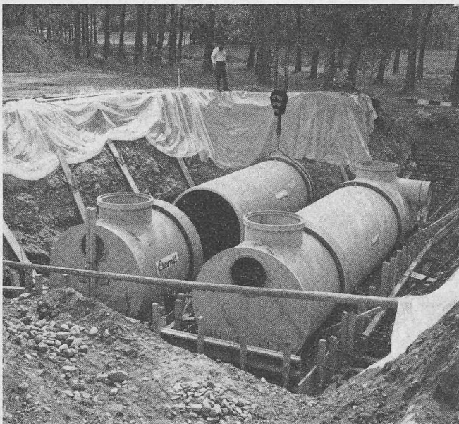
Vorfabrizierte Rückhaltebecken für Lucens VD