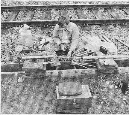
Bild 10. Kabelmonteur bei der Spleissarbeit