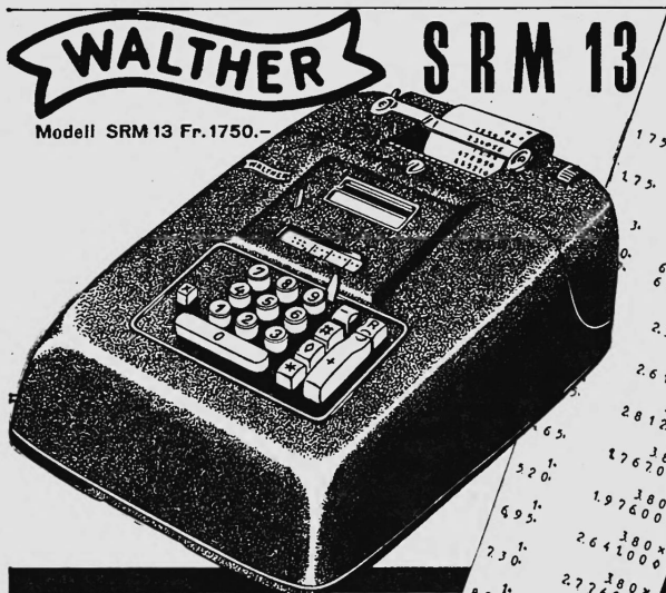
Modell SRM 13 Fr. 1750.-

Rédaction: Division du commerce du Département fédéral de l'économie publique, Berne