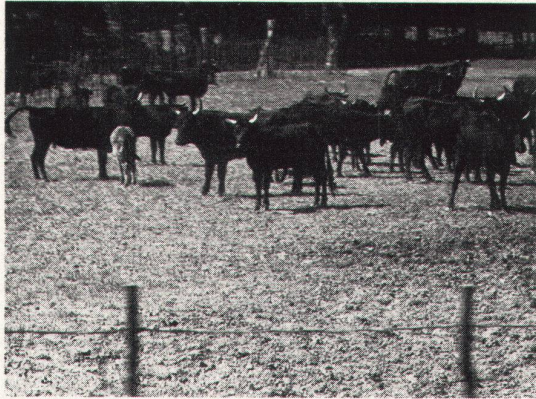
sie friedliche Menschen die füßt nicht ---

Die Provence sehen mit eigenen Augen, ihre Wirklichkeit erleben mit Kollegen, Franzosen treffen, wäre das nicht herrlich? Doch mit den einfachen, selbstbildeten Wirklichkeit befüßt sich ein