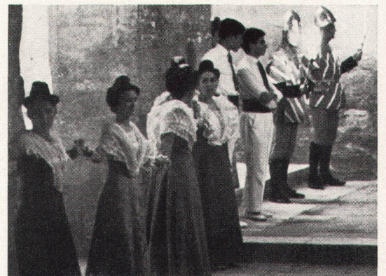
wird zum Mummenschanz