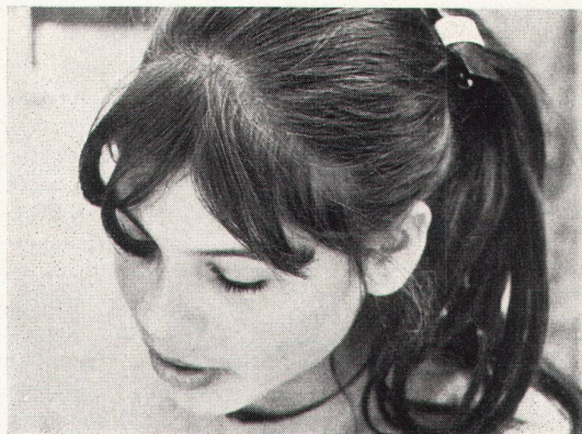
einfache Schönheit ---