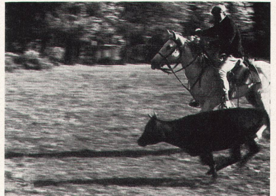
zu unserer Unterhaltung wird ein Korb gefüllt und ge- quält.

Achtet nicht. Er sucht das vorfabrizierte Bild, von Reitano geliefert. Der Schritt von der ein- fachen Wirklichkeit zum Tampbild ist klein -