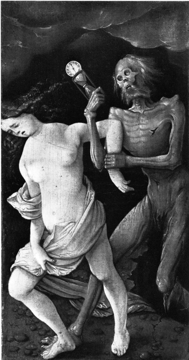
Abb. 4 Hans Baldung Grien: Tod und Mädchen. Um 1513. 13 × 17 cm. Museo nazionale del Bargello, Florenz

erstehungsgedanken. Den Tod, der mit einem Bein im Grab steht und den Menschen zu sich holt, übernahm er spätmittelalterlicher Tradition (Tonmodell um 1450/70, Abb. 1 14 ; Stich des Meisters BR mit dem Anker, «Tod und Jüngling», um 1470/80 15 ; aggressivere Formulierung auf dem um 1505/10 entstandenen Kartenspielstich des Monogrammisten PW, Abb. 2 16 ). Auf Baldungs 1517 datiertem Bildchen «Tod und Mädchen» (Abb. 5) wird das Grab zum finsternen Abgrund analog der kompositionellen Anlage seiner Gemälde der «Wetterhexen» von 1523 und der «Prudentia» (in diesem Heft besprochen von Jean Wirth).