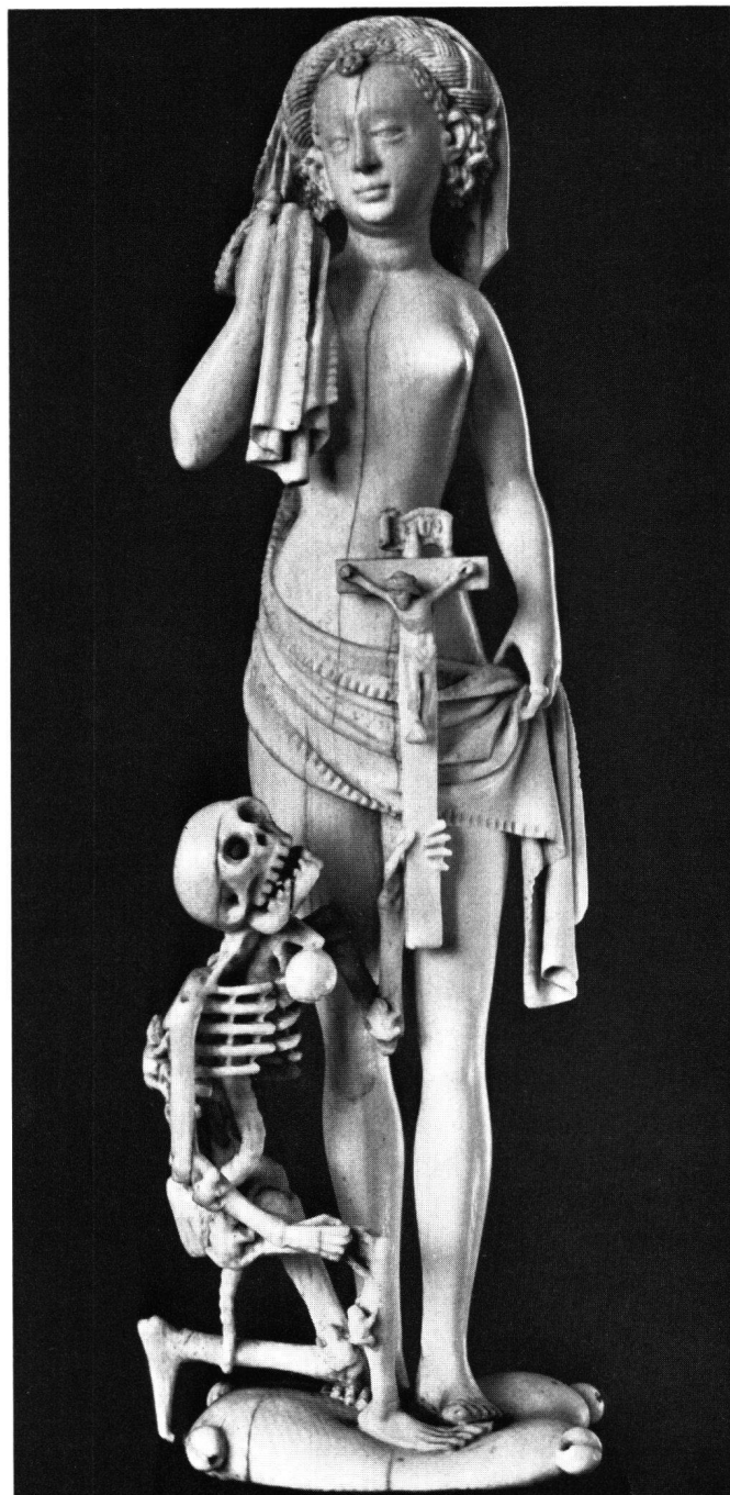
Abb. 3 Französischer oder deutscher Meister: Tod und Mädchen. Um 1500/30. Elfenbein. Höhe 14,5 cm. München, Bayerisches Nationalmuseum (MA 2045)

wie auf dem Bargello-Bild eines Todes, der das Mädchen ins Grab zerrt (Abb. 4). Dieses Mädchen versteht sich, trotz des Leichentuches, nicht als eine magisch Auferstehende, sondern als ein Mensch, der jetzt sterben muß und sich dem Eintauchen ins Reich der Toten in absurder Weise zu widersetzen sucht. Baldung benutzte und veränderte in gewagter Weise den christlichen Todes- und Auf-