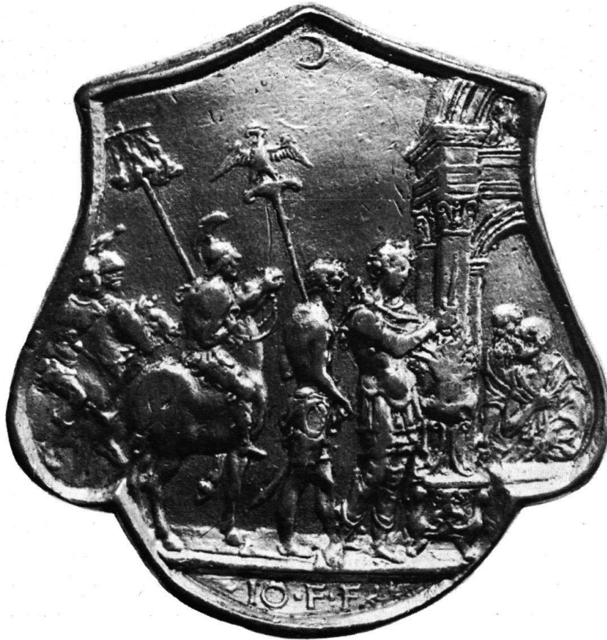
Abb. 5 Mucius Scaevola, Plakette. Vergrößert.