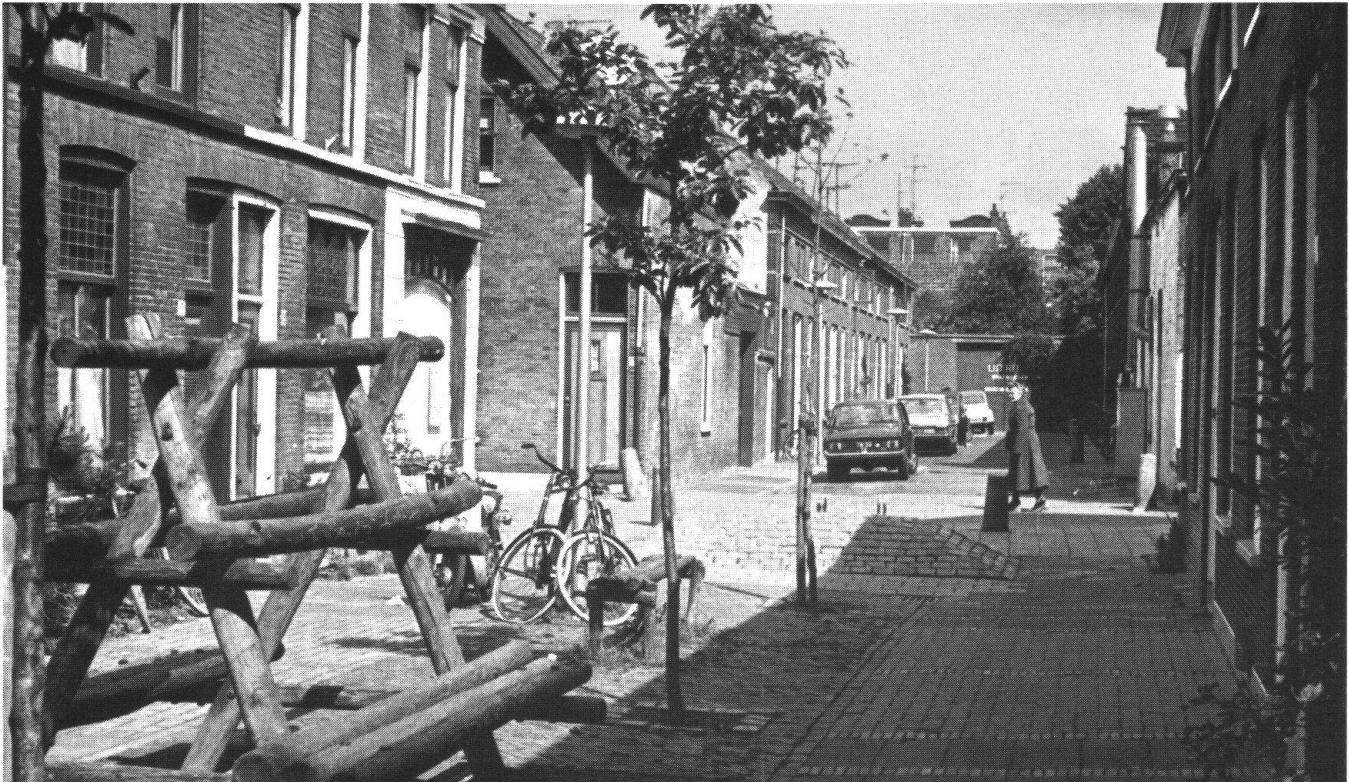
Aus dem niederländischen Delft kommt die Wohnstrassenidee: Hier wurden erstmals Strassen dem Verkehr entweicht und den spazierenden, arbeitenden und spielenden Menschen zur Verfügung gestellt (Bild Michel).