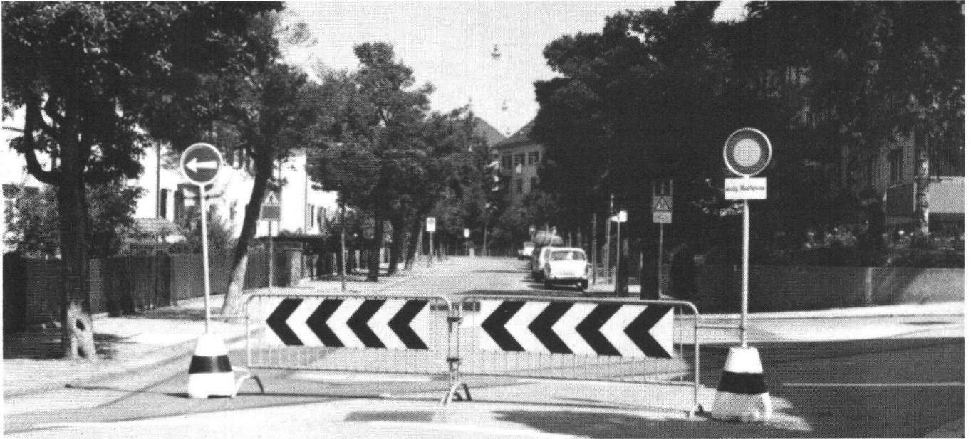
In Zürich wurde das Irchel-Quartier vom Verkehr entlastet: eine grossflächige Wohnschutzmassnahme. Wie Verkehrszählungen zeigten, nahm der Verkehr bis zu 78 Prozent ab (Bild Rohr).