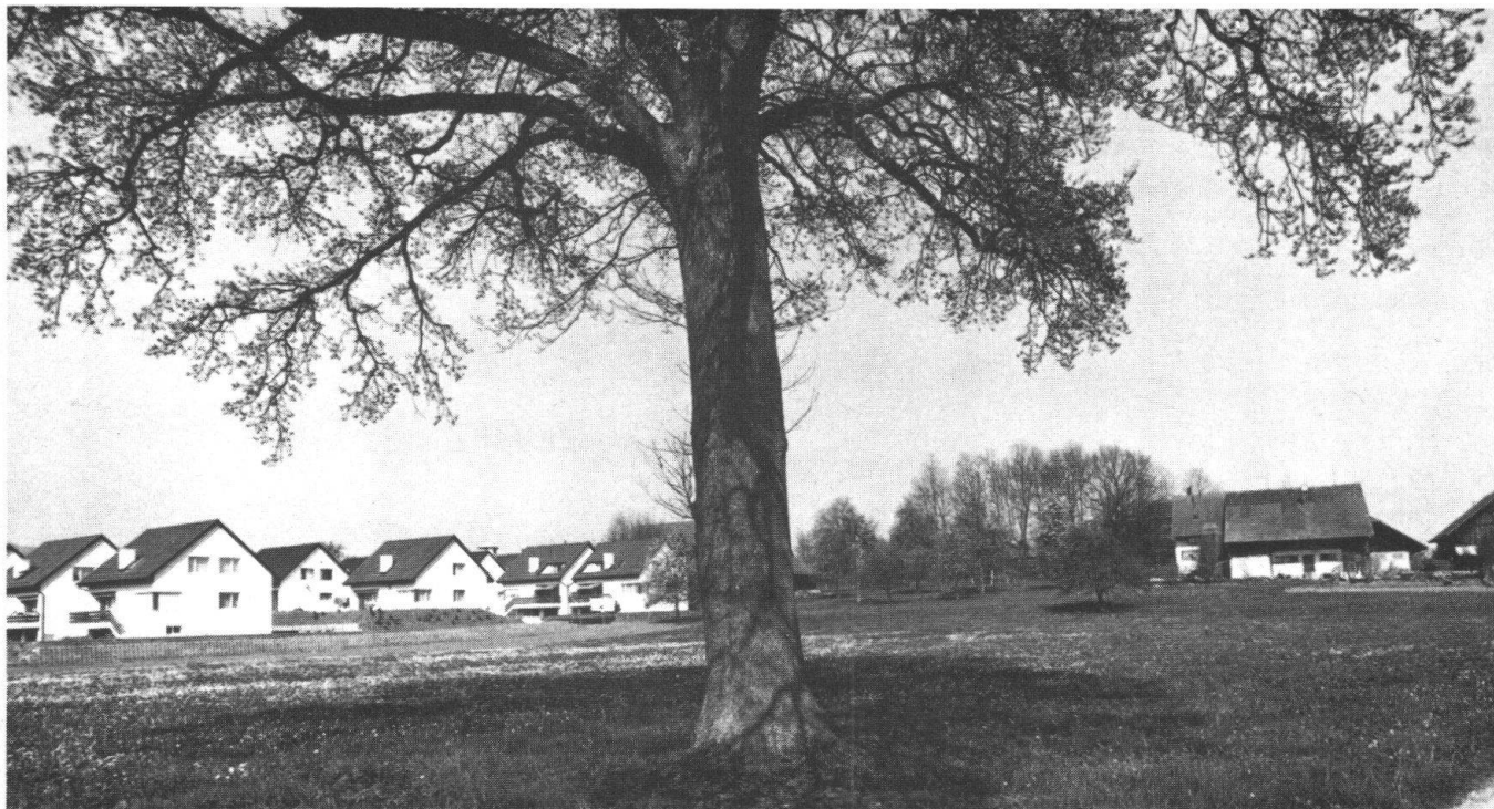
Je stärker die Bevölkerung im Einzugsgebiet der Städte wächst, desto mehr Grünraum geht verloren: Der Rand der Zürcher Oberländer Gemeinde Mönchaltorf rückt dem einst alleinstehenden Bauernhaus immer näher.

(Zürich) in einem Aufsatz. Dafür mitverantwortlich ist die splitterhafte Auftrennung der Bereiche Wohnen, Arbeiten, Spiel und Erholung: Die einzelnen Lebensbereiche haben keine Beziehung mehr untereinander.