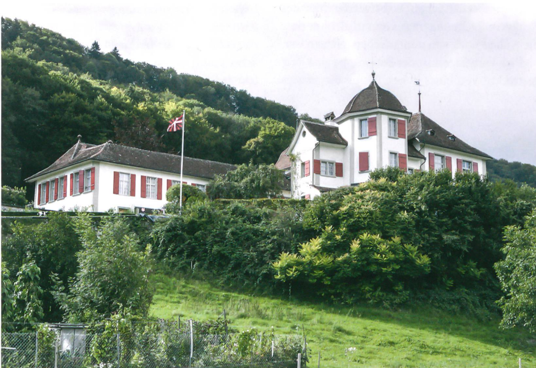
Abb. 1: Toffen, Schloss. Ansicht von Südosten.

Die bekannten Ansichten stammen von Albrecht Kauw, der um 1670 im Auftrag des damaligen Schlossherrn die Anlage von der Berg- und von der Talseite in bekannt zuverlässiger Manier porträtierte (Abb. 2). Die imposante Talansicht wird dominiert von einem viergeschossigen Höchhus mit hoch aufragendem