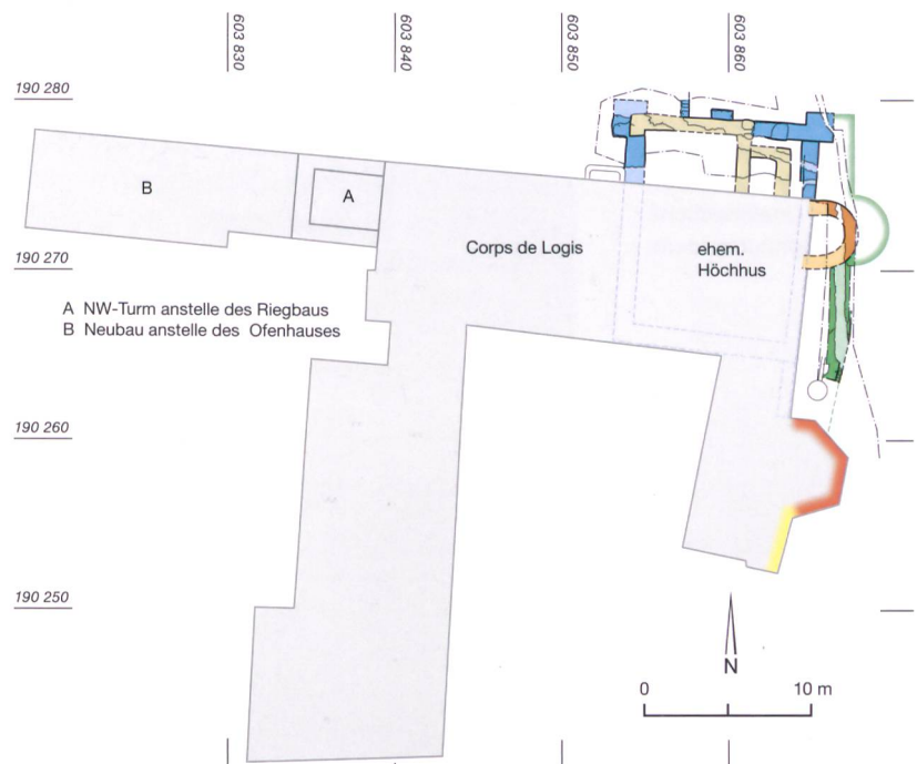
Abb. 5: Toffen, Schloss. Übersichtsplan mit den Baubefunden der archäologischen Grabung im Sommer 2014. Die Farbgebung der freigelegten Mauern entspricht der von Abb. 2 und 3. M. 1:500.