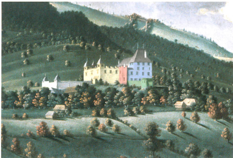
Abb. 2: Toffen, Schloss. Ansicht von Südosten, nach Albrecht Kauw, 1667, Privatbesitz. Die Einfärbung der Bauelemente korrespondiert mit der Farbgebung der Baubefunde auf dem Übersichtsplan von Abb. 4.