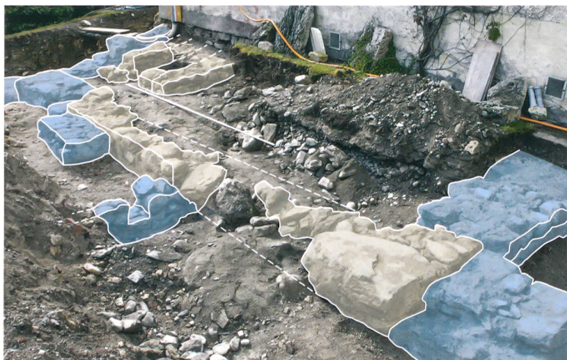
Abb. 3: Toffen, Schloss. Untersuchungsbereich nördlich des heutigen Schlosses mit Mauerresten der Vorgängerbauten (braun) und des Höchhus (blau). Blick nach Südosten.

Walmdach, ein für die Zeit des 16. Jahrhunderts charakteristischer herrschaftlicher Bau (blau). In Steffisburg ist ein vergleichbares Gebäude bis heute erhalten geblieben. Vorangestellt ist dem Hauptgebäude ein von einer mächtigen Brüstungsmauer und einem halbrunden Turm (grün) eingefasster schmaler, zwingerartiger Hof. An der Südostecke sind dem Höchhus ein kleiner Zwischentrakt (blau) und ein zum Tal hin vorspringender polygonaler Treppenturm angefügt (rot). Im Süden schliesst eine dreiflügelige Hofanlage die Baugruppe ab (gelb). Ecktürme und ein Zinnenkranz verleihen den Schlossbauten ein wehrhaftes Aussehen, das dem gesellschaftlichen Selbstverständnis des Bauherrn Rechnung trägt, vermutlich ohne dass die Anlage noch von militärischem Nutzen war. Südlich vorgelagert ist der Baugruppe eine langgestreckte, von einer hohen Mauer eingefasste