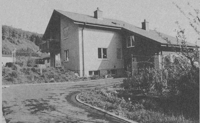
Einfamilienhaus mit Wärmepumpe und Holzheizung

Merker AG, Metallwaren- und Apparatefabrik, 5401 Baden