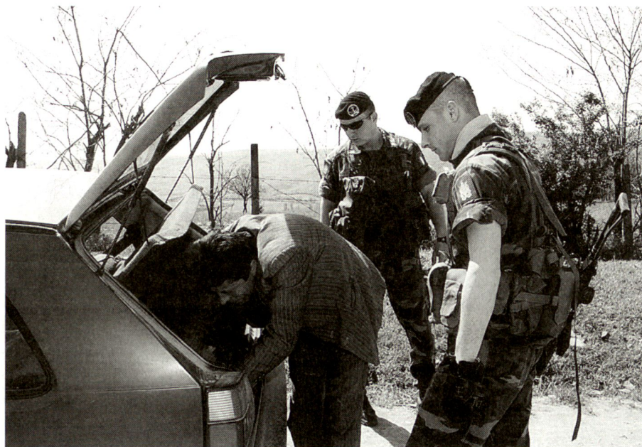
Posto di blocco.

compito, evitino di suscitare il risentimento della popolazione e pregiudicare il consenso dell'opinione pubblica, indispensabile per il successo dell'operazione.