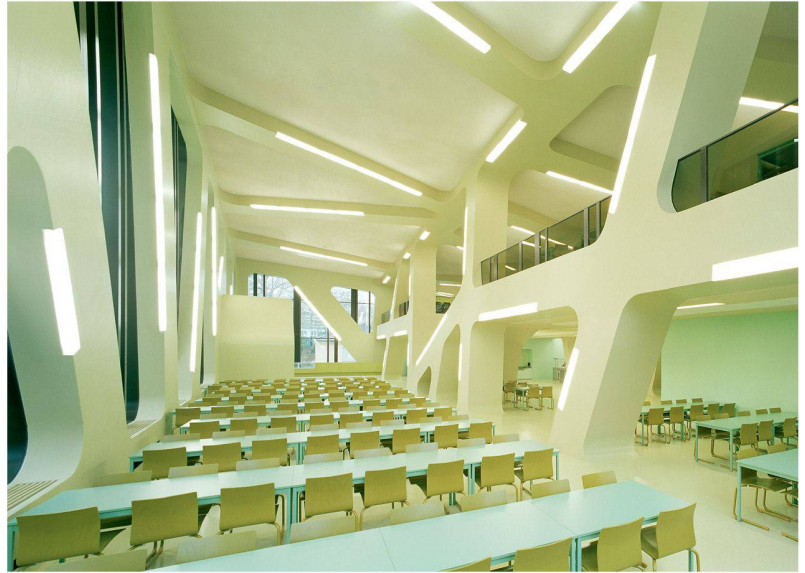
01–02 Mensa Moltke in Karlsruhe, 2005–2007

«Der Handel mit Zertifikaten hat auch etwas hoch Spekulatives.»