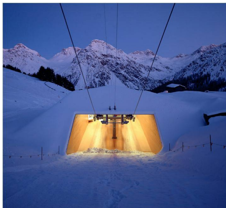
01 Sesselbahn Carmena in Arosa, Bearth & Deplazes Architekten

Unter dem Titel «Alpine Architektur und Tourismus: Quo vadis?» organisieren Seilbahnen Schweiz und der SIA am 5. November 2010 eine Tagung im Schweizerischen Alpen Museum in Bern. In Referaten und einer Podiumsdiskussion sollen die heutigen und zukünftigen Wechselwirkungen zwischen Architektur und Tourismus im alpinen Kontext aus unterschiedlicher Perspektive beleuchtet werden.