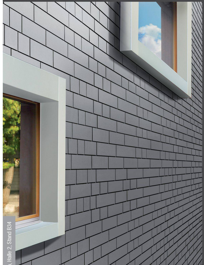
Besuchen Sie uns: Bauen+Wohnen Luzern, Halle 2, Stand B34

Kleinformatige Faserzementplatten der Eternit (Schweiz) AG