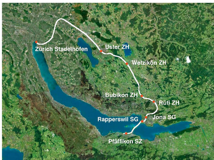
01 «S5-Stadt»: Der Bau der S5 gilt als einer der grundlegenden Faktoren für die rasche räumliche Entwicklung dieser Region. Mittlerweile verdichtet die S15 den Takt auf dieser Strecke (Plan: ETH Wohnforum – ETH CASE)