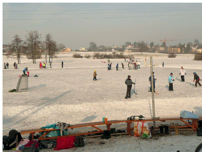
02 Eine gemeinsame Identifikation der Agglomerationsbevölkerung mit dem Siedlungsraum der «S5-Stadt» existiert nicht. Nur die Naturräume wie hier das «Hüsliriet» bei Bubikon könnten eine identitätsstiftende Klammer bilden

Ein grosser Teil der Schweizer Bevölkerung lebt heute in Agglomerationen. Wie sollen diese nach wie vor stark wachsenden Gebiete gestaltet werden, damit es sich dort gut leben lässt? Dieser Frage ging das Forschungsprojekt «Stand der Dinge – Leben in der «S5-Stadt»» am Beispiel des Lebensraumes entlang der Bahnlinie S5 zwischen Zürich und Pfäffikon SZ nach. Das hier vorgestellte Teilprojekt befasste sich mit der Bedeutung der Naturräume.