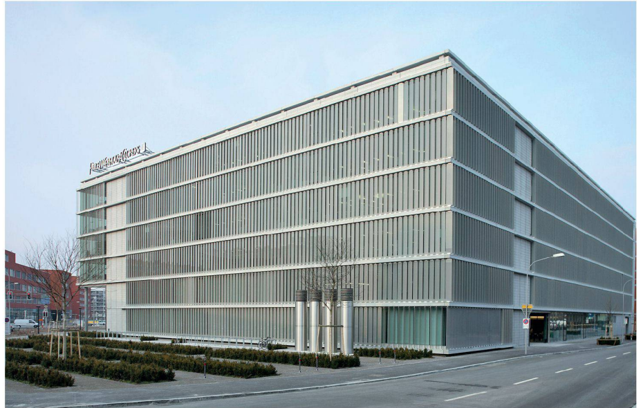
01 Aussenansicht PricewaterhouseCoopers in Zürich Oerlikon