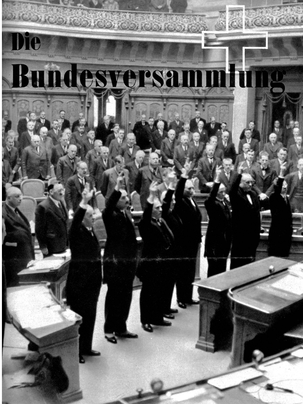
Der Schwur der sieben Bundesräte und des Kanzlers auf die Verfassung

Davon merkt man eigentlich außerhalb dem Bundespalais herzlich wenig. In den heimeligen Lauben Berns begegnet man zwar hin und wieder mal einem oder einem Trüpplein Räte, und der Eingeweihte weiß natürlich sehr gut, wo er zwischen den Sitzungen unsere Landesväter findet, werden doch immer gewisse Lokale und Restaurants bevorzugt. Steckt man aber seine Gwundernase in die Ratsäle hinein, so bekommt man