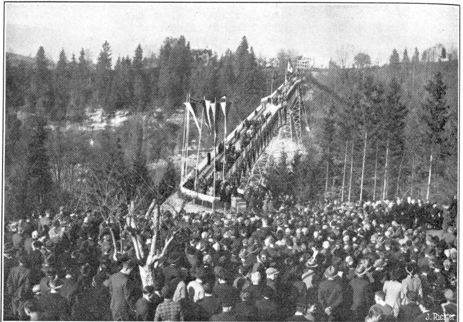
Einweihung der grossen Brücke über das Hundwiler Tobel.

So bringt das Finanzprogramm schließlich an Einsparungen und Einnahmen, statt die vom Bundesrat beantragten 223, im-