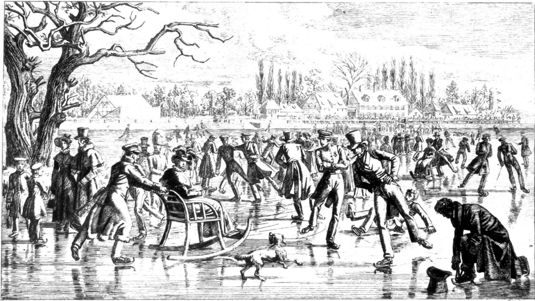
Johann Adam Klein. Die Schlittschuhbahn zu Nürnberg

warmen Januartag im Jahre 1737 mit großer Sorge von Campodolcino jenseits des Splügens gegen die Cardinellgalerien hinauf. Er kam von Chiavenna mit Seidenballen auf dem von zwei starken Pferden gezogenen Schlitten und sollte mit der Ware am Abend in Splügen sein. So hatte es der Patron drunten in Chiavenna durchgesehen, obwohl er ihn gewarnt hatte, die Ware könne bei dem Tauwetter ja samt den Pferden zugrunde gehen. „Die Sacke muß eute noch über die Spluga, kann nix dafür, Sie aben es mir versprochen“, hatte der Patron gesagt, und was wollte er, Luzi Risch, machen? Er hatte am Abend vorher zu seiner Frau Lisbeth gesagt, als sie geklagt hatte, der Föhn drücke so stark, und er leide sicher noch Schaden, wenn er am folgenden Tag hinüberfahre: „Lisbeth, hab' keine Angst, die Rosse, Mark und ich kommen schon gut durch, und ich habe es dem Patron drüben in Chiavenna versprochen, daß ich komme. Du weißt, wenn ich nicht gehe, nimmst er einen andern, und wir haben den Verdienst nötig.“ Da hatte Frau Lisbeth geschwiegen und ihm am Morgen früh noch einmal ans Herz gelegt, ja gut zu sich aufzupassen.