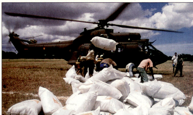
Spanischer Militärhelikopter «Super Puma» bei Hilfeinsätzen in Afrika.

Die spanische Militärführung hat diesen Herbst bekräftigt, dass im nächsten Jahr nebst dem weiter laufenden Truppeneinsatz auf dem Balkan vor allem die internationale Stabilisierungstruppe für Afghanistan (ISAF) unterstützt werden soll. Spanien wird dabei zusammen mit italienischen Truppen mehr Führungsverantwortung für die PRTs in den westlichen Provinzen Afghanistans übernehmen. Das spanische Kontingent bei der ISAF beträgt gegenwärtig rund 1400 Soldaten; bei Bedarf soll im nächsten Jahr dieser Bestand allenfalls erhöht werden. Zudem wird mit einem vermehrten Einsatz der Streitkräfte für humanitäre Hilfeleistungen in Afrika gerechnet. hg