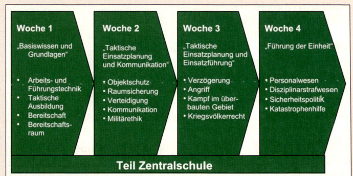
Lehrinhalte im FLG I