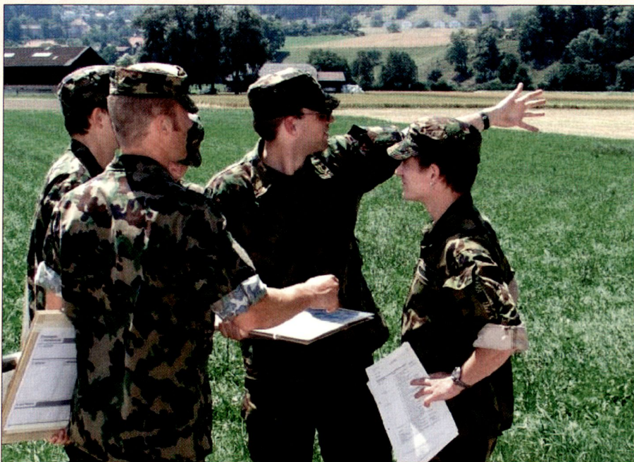
Befehlsgebung an die Zfhr: Übungssequenz im FLG I