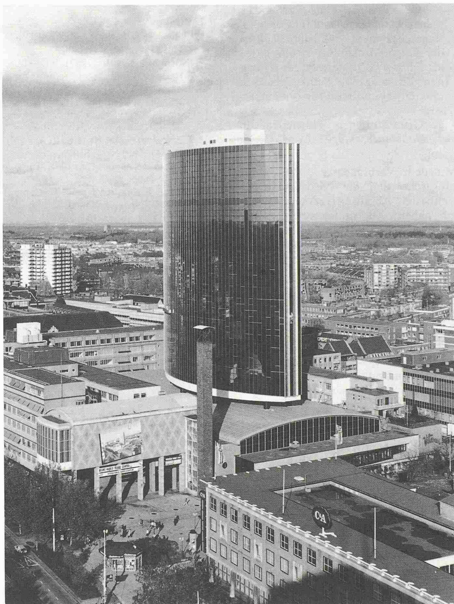
Bild 1. Überbauung des 40 Jahre alten Messegebäudes in Rotterdam mit einem 21stöchigen Verwaltungshochhaus (World Trade Centre) als aufgeständerte Stahlbetonkonstruktion